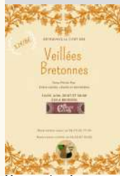
Morgane de crêpes

Beignon Morgane de Crêpes Veillées bretonnes le 20/08/2022 Tarifs Payant