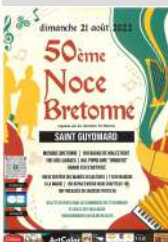
Association Les Chevaliers de Saint-Maurice