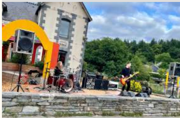
Riff R'Aff et Le Bar Breton

La Gacilly Les concerts du vendredi présentés par Riff R'Aff et le Bar Breton Place de La Ferronnerie le 26/08/2022 Le 16/09/2022 Tarifs Gratuit