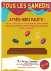
Le Champ Commun

Augan Le Champ Commun Venez jouer aux palets le 20/08/2022 Le 27/08/2022 Tarifs Gratuit