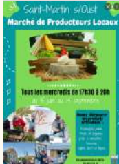
Mairie Saint-Martin sur Oust

Saint-Martin-sur-Oust Marché estival des producteurs locaux Place de la Motte du 17/08/2022 au 14/09/2022 Tarifs Gratuit