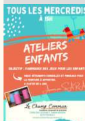
Le Champ Commun

Contact : 02 97 93 48 51 estaminet@lechampcommun.fr