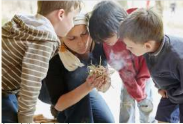
Association Les Landes

Monteneuf Démonstration d'allumage de feu Menhirs de Monteneuf du 04/07/2022 au 26/08/2022 Tarifs Payant 4 / 6,5 €