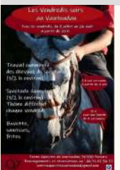
Centre équestre du Vautoudan

le 19/08/2022 Le 26/08/2022 Tarifs Payant 5 / 15 €