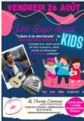
Le Champ Commun

le 26/08/2022 Tarifs Libre participation