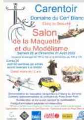
Au Pays des Leds

Carentoir Domaine du Cerf Blanc Salon de la maquette et du modélisme le 20/08/2022 Le 21/08/2022 Tarifs Payant