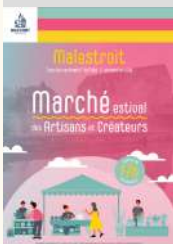
Mairie de Malestroit