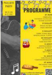
Les Enfants Gatés