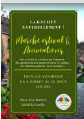
Mairie de La Gacilly

le 19/08/2022 Le 26/08/2022 Tarifs Gratuit