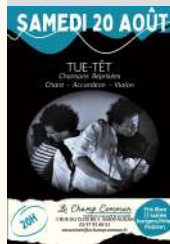
Le Champ Commun

Augan Le Champ Commun Concert : Tue Têt, poésie-guitare-violon au Champ Commun le 20/08/2022 Tarifs Libre participation