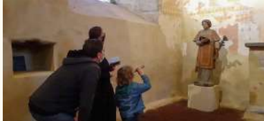
Association Les Landes

Guer Jeu de piste au prieuré Saint-Etienne Saint-Etienne du 17/08/2022 au 21/08/2022 du 24/08/2022 au 28/08/2022 Tarifs Payant 3 / 6 €