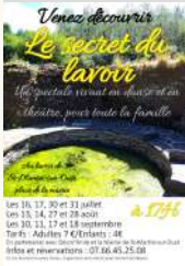
Mairie Saint-Martin sur Oust

le 27/08/2022 Le 28/08/2022 Tarifs Payant