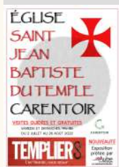
Eglise du Temple

Carentoir Le Temple Visites guidées de l'Eglise du Temple du 20/08/2022 au 21/08/2022 du 27/08/2022 au 28/08/2022 Tarifs Gratuit