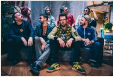
Mairie de Malestroit