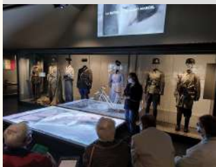
Musée de la Résistance

Saint-Marcel Visite accompagnée portraits de femmes Musée de La Résistance en Bretagne le 24/08/2022 Tarifs Payant 2 / €