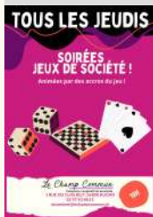
Le Champ Commun

Contact : 02 97 93 48 51 estaminet@lechampcommun.fr