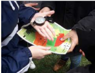
Musée de la Résistance en Bretagne

Saint-Marcel Jeu de piste "Mission DZ 44" Musée de La Résistance en Bretagne le 17/08/2022 Tarifs Payant 5 / €