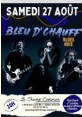
Le Champ Commun

le 27/08/2022 Tarifs Libre participation