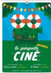
Maxime Le Clanche

le 21/08/2022 Tarifs Libre participation