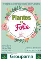
asso Fleurir La Gacilly

Contact : 02 99 08 11 15 fleurirlagacilly56@gmail.com