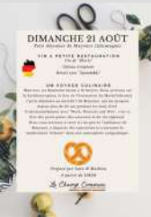
Le Champ Commun

le 21/08/2022 Tarifs Libre participation