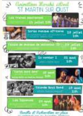
Mairie Saint-Martin sur Oust

Saint-Martin-sur-Oust Concert des Yolande Boys Band Place de la Motte le 17/08/2022 Tarifs Gratuit