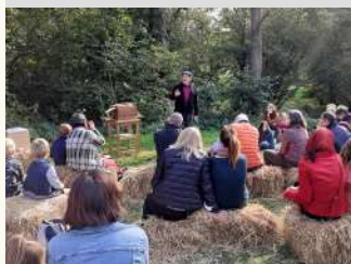
Théâtre Equestre de Bretagne

Contact : 06 09 25 42 50 contact@equusarte.com