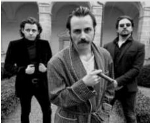
Mairie de Malestroit