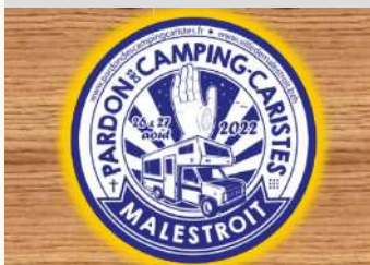
Mairie de Malestroit

Malestroit Pardon des camping-caristes Chemin de l'ecluse le 26/08/2022 Le 27/08/2022 Tarifs Payant