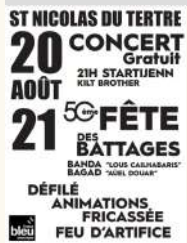
Comité des fêtes de Saint-Nicolas du Tertre

Saint-Nicolas-du-Tertre 50ème Fête des battages du 20/08/2022 au 21/08/2022 Tarifs Gratuit