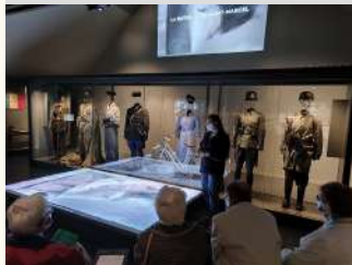
Musée de la Résistance

Saint-Marcel Visite accompagnée la Résistance: des premiers actes à la libération Musée de La Résistance en Bretagne le 26/08/2022 Tarifs Payant 2 / €